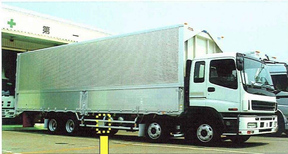
(ウイングトレーラー車)