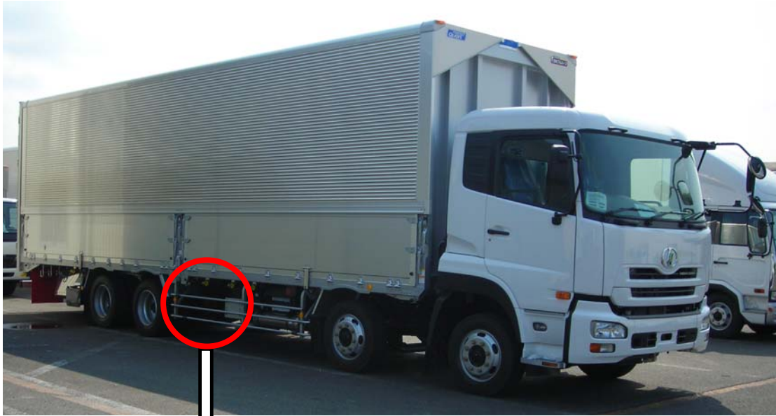
(大型ウイングルフ車両)