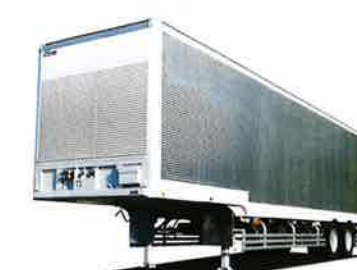
鹅颈式厢式半挂车