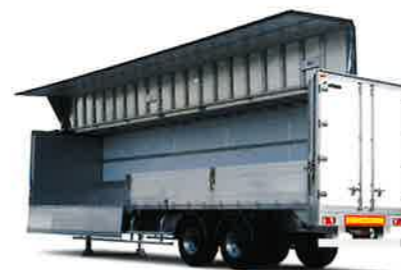
2011年东京车展展品下一代铝制半挂车