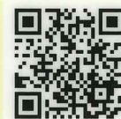
トレーラ日常点検について

https://www.youtube.com/watch?v=pXzBSECXsOI