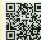
トレーラ定期点検整備のすすめ

https://www.youtube.com/watch?v=GzjMI2TayF4