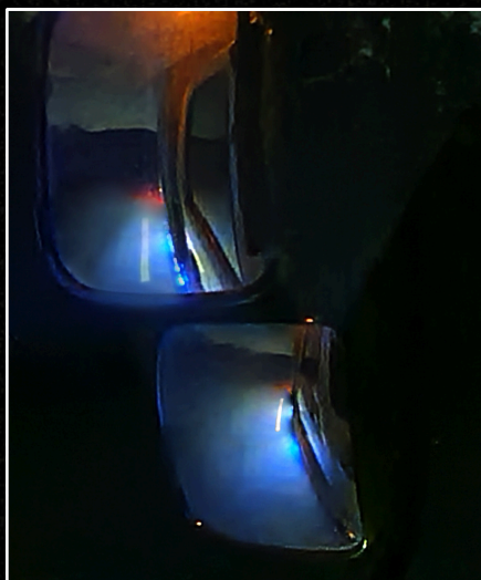
▲オプションなしの場合