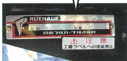
昇降装置製造銘板